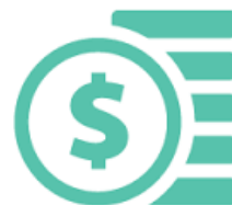
THẨM ĐỊNH GIÁ