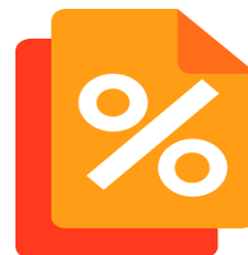
TƯ VẤN THUẾ