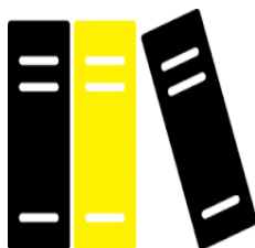
DỊCH VỤ KẾ TOÁN