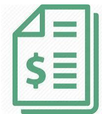
KIỂM TOÁN BÁO CÁO TÀI CHÍNH

Dịch vụ Kiểm toán Báo cáo tài chính và Các Dịch vụ chuyên ngành khác