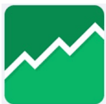
TƯ VẤN TÀI CHÍNH