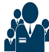
TƯ VẤN HOẠT ĐỘNG