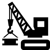
KIỂM TOÁN XÂY DỰNG CƠ BẢN